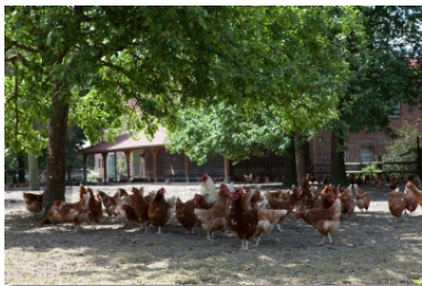
Ob Stallgebäude oder Grünauslauf - auf dem Hof der Altfelds gehen die Hennen ihre eigenen Wege.