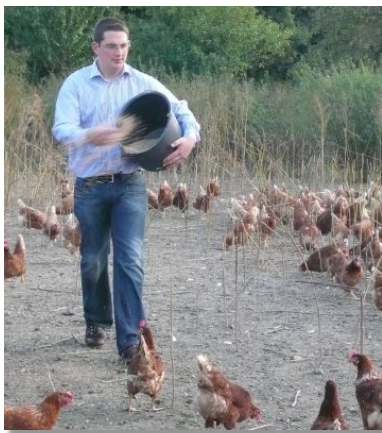
Konsequent biologisch: Die Hühner werden zu 100% mit Bio-Futter versorgt.